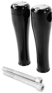
TC BROS. 6" BLACK SPRINGER RISERS FOR 1" DIAMETER HANDLEBARS TC Bros. SKU: 101-0226