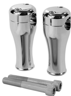
TC BROS. 4" CHROME SPRINGER RISERS FOR 1" DIAMETER HANDLEBARS TC Bros. 101-0223