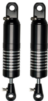
Pan Cruise 1999