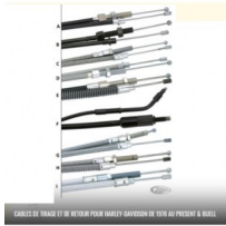
CABLES DE TIRAGE ET DE RETOUR POUR HARLEY-DAVIDSON DE 1976 AU PRESENT & BUELL

ref:722724 CABLE DE RETOUR ACIER TRESSE GAINÉ CHROMITE STERLING POUR TOURING DE 96 A 2001 INJECTION AVEC CRUISE CONTROL 130 cm ou 52"