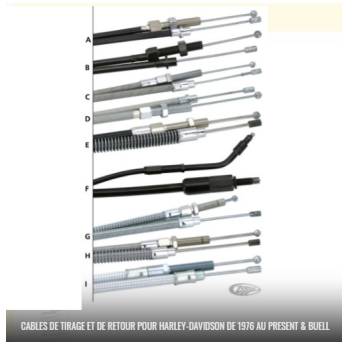
CABLES DE TIRAGE ET DE RETOUR POUR HARLEY-DAVIDSON DE 1976 AU PRESENT & BUELL