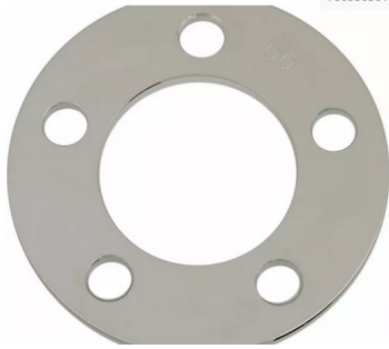
Entretoise de poulie ou couronne